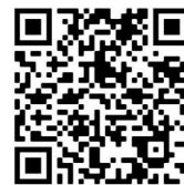
Der direkte Weg zu St.Vitus-TV!