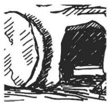
Ostern: Liebe leben

Die Feier der Auferstehung beginnt am Karsamstag um 20 Uhr mit der Entzündung der Osterkerze am Osterfeuer vor dem ehemaligen Küsterhaus/ Nähcafe. Für die Teilnehmenden DRAUSSEN werden einige Bankreihen in der Kirche reserviert! Für die Lichtfeier werden vor dem Gottesdienst Kerzen zum Kauf angeboten.