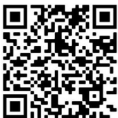
Der direkte Weg zu St.Vitus-TV!